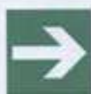
E 02-01 Направляющая стрелка