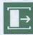
E 20 Для открывания сдвинуть