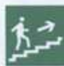
E 15 Направление к выходу по лестнице вверх