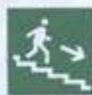
E 13 Направление к выходу по лестнице вниз