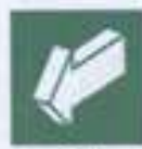
E 19 Открывать на себя