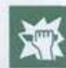
E 17 Для доступа вскрыть здесь