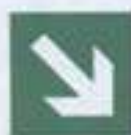
E 02-02 Направляющая стрелка под углом 45 град