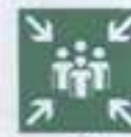
E 21 Пункт (место) сбора