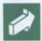
E 18 Открывать от себя