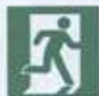
E 01-02 Выход здесь